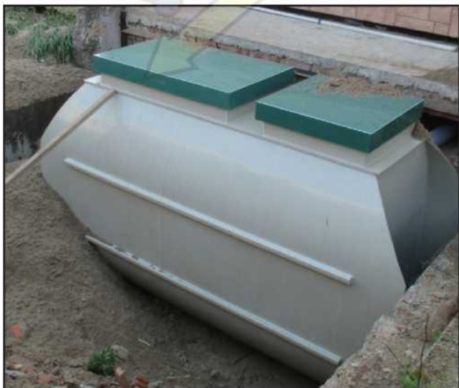
По желанию Заказчика подвод трубы осуществлен справа