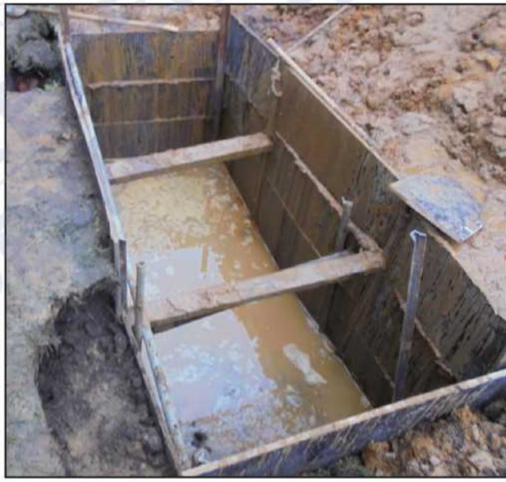
При обнаружении плавуна необходимо применение опалубки.

3. Корпус установки размещать на основании из уплотненного песка толщиной не менее 100мм.