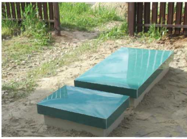
Размещение возле входа на участок для удобства сервисного обслуживания (удобный подъезд ассенизационной машины)