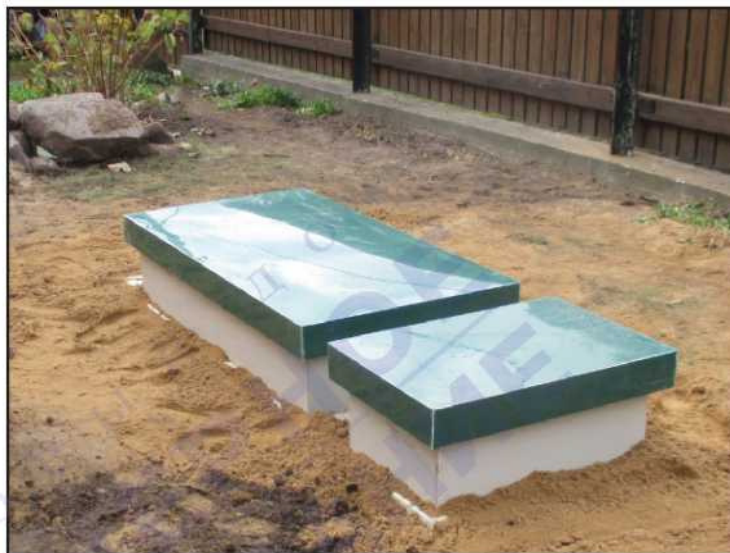
Увеличение горловин для последующей подсыпки плодородного грунта

Основная задача состоит не только в том, как правильно разместить септик «ТВЕРЬ», вписав в существующий ландшафт, но и минимизировать расходы при монтаже, эксплуатации и обслуживании.