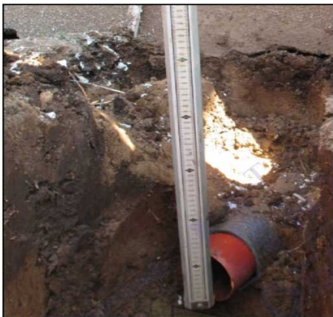
Заглубление трубы из дома на 45 см