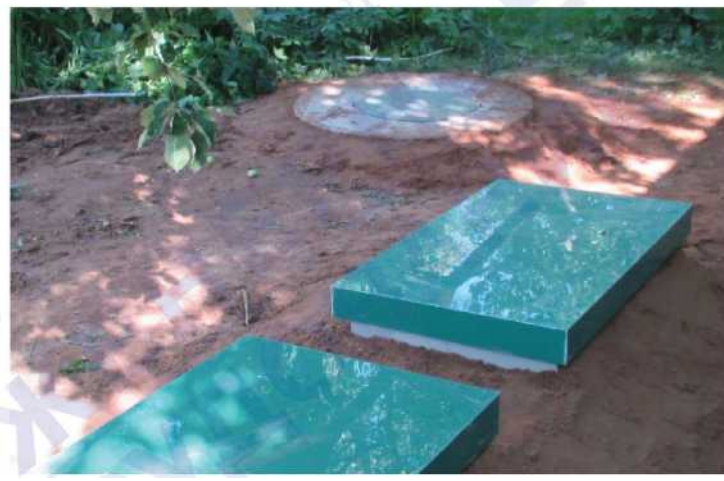
Сброс очищенной воды в поглощающий колодец