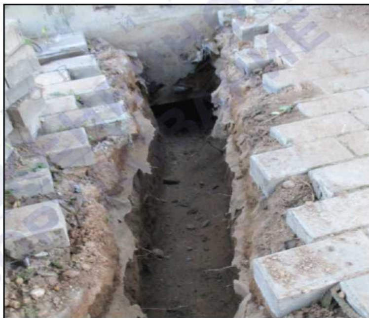
Пришлось разбирать плитку для подведения трубы канализации